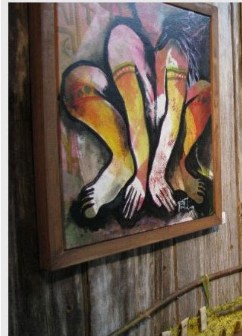
L'Atelier permet aux artistes de créer des œuvres dans un milieu vert presque en pleine nature.

Pour plus d'informations : 2821, rue Notre-Dame Est, Trois-Rivières, 819-374-1420